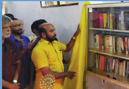
ശ്രീവിധാസം ലൈബ്രറി ഉദ്ഘാടനം