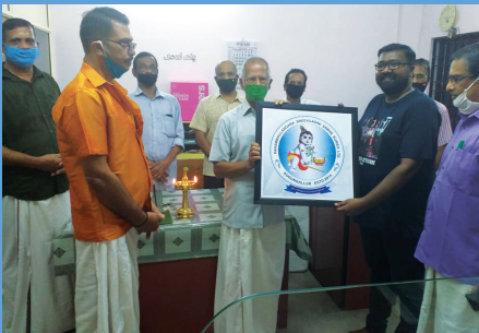
കമ്പനി ലോഗോ പ്രകാശനം