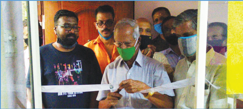
കമ്പനി ഓഫീസ് ഉദ്ഘാടനം