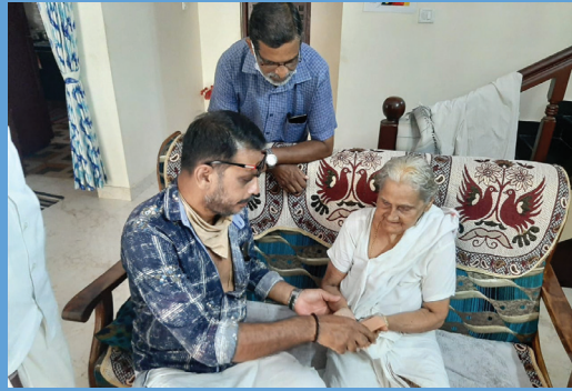
സപ്തതി സമ്മാൻ പെൻഷൻ വിതരണം