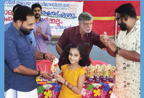
സാംസ്കാരിക പരിപാടി - സമ്മാനവിതരണം