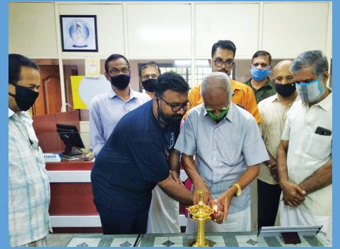
നവീകരിച്ച കമ്പനി ഓഫീസ് ഉദ്ഘാടനം