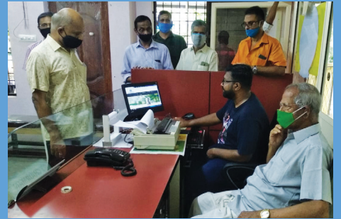
കമ്പനി വെബ്സൈറ്റ് ഉദ്ഘാടനം