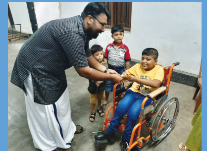
മികച്ച വിദ്യാർത്ഥിക്കുള്ള അവാർഡ് വിതരണം