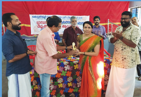
സാംസ്കാരിക പരിപാടി - സമ്മാനവിതരണം