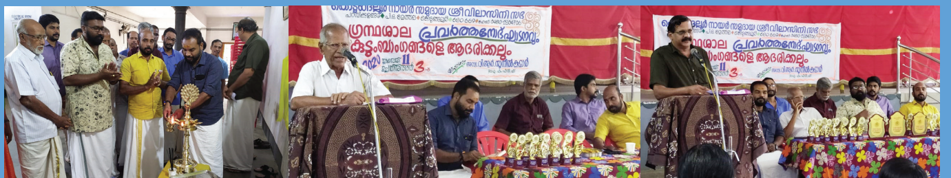
ഗ്രന്ഥശാല പ്രവർത്തനോദ്ഘാടനവും - കുടുംബാംഗങ്ങളെ ആദരിക്കലും