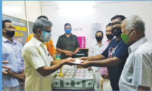
ഡയാലിസിസ് സംഖ്യ സ്വീകരണം